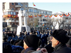
1 decembre 2018 Calarasi