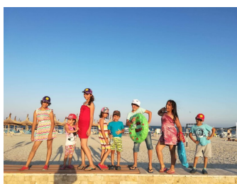
vacances à la mer