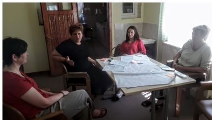
Réunion de travail