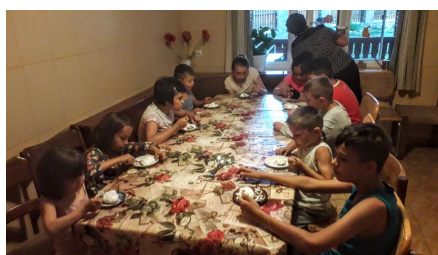
repas au foyer