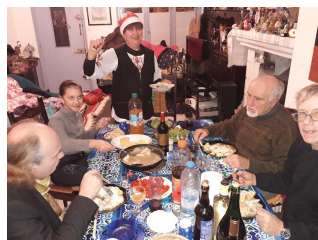
Repas Mocapi /Synergie

Avant notre exposé le public avait une connaissance limitée de la Roumanie : Caucescu , Nadia Comaneci ....Les personnes ont été très surprise par la différence de niveau de vie entre la France et la Roumanie.