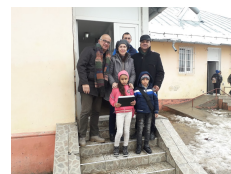
Remise du matériel