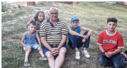
les enfants du foyer

.Le président avait déjà rencontré Amurtel en juillet et novembre 2016 .Suite à ces échanges , il a été décidé de lancer une cagnotte pour co financer un séjour mer/montagne pour les enfants de la famille Amurtel de Panatau (230 euros collectés).En juillet 2019, le Président a rencontré les enfants comme les responsables d'Amurtel .Une convention de partenariat a été établie entre Synergie et Amurtel et nous avons rejoins les groupe des sponsors. Grâce à Whatsapp , nous avons régulièrement des nouvelles des vacances des enfants .