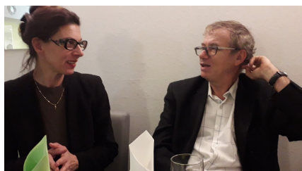
réunion du 23 novembre 2018