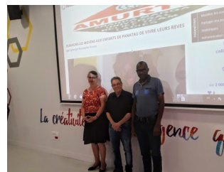
cagnotte pour Panatau